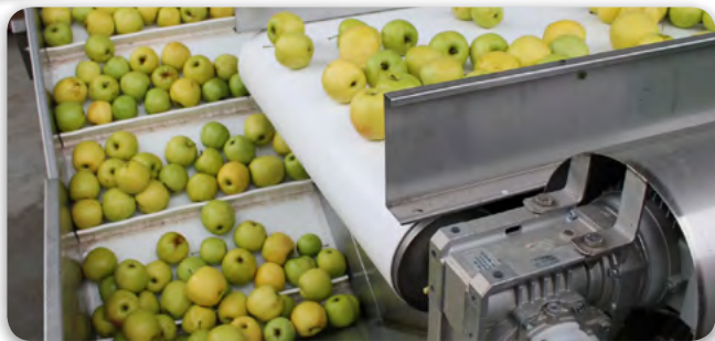
KIZÁRÓLAG A TÉSZ TAGJAI ÁLTAL ELŐÁLLÍTOTT ALAPANYAGOK FELHASZNÁLÁSÁVAL